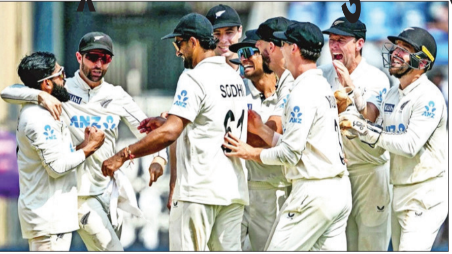
2024 માં, મહેમાન ટીમો પહેલાં કરતાં સૌથી વધુ વખત ટેસ્ટ મેચો જીતી

વેસ્ટ ઈન્ડિઝના ઈંગ્લેન્ડના 1981 નો પ્રવાસ વિદેશમાં ટેસ્ટ સિરિઝમાં પડકારો માટે ઉપયોગી માર્ગદર્શક તરીકે કામ કરે છે. જ્યારથી ટેસ્ટ ક્રિકેટની શરૂઆત થઈ ત્યારથી, પ્રવાસી ખેલાડીઓ માટે પરાજયવાદી દૃષ્ટિકોણ લેવો સરળ બની ગયું હતું પરંતુ હવે આ દૃષ્ટિકોણ બદલવા લાગ્યું છે. ઐતિહાસિક રીતે યજમાન ટીમોની તરફેણમાં અવરોધો હોતાં નથી જેમ કે મૈત્રીપૂર્ણ અમ્માયરો હોય, પરિસ્થિતિઓનું જ્ઞાન હોય કે ઘરની સુખ-સુવિધાઓ હોય તેથી ટેસ્ટ ઈતિહાસમાં માત્ર બે વાર જ મુલાકાત લેનાર પક્ષોએ એક વર્ષમાં તેમની 40 ટકાથી વધુ મેચો જીતી છે.