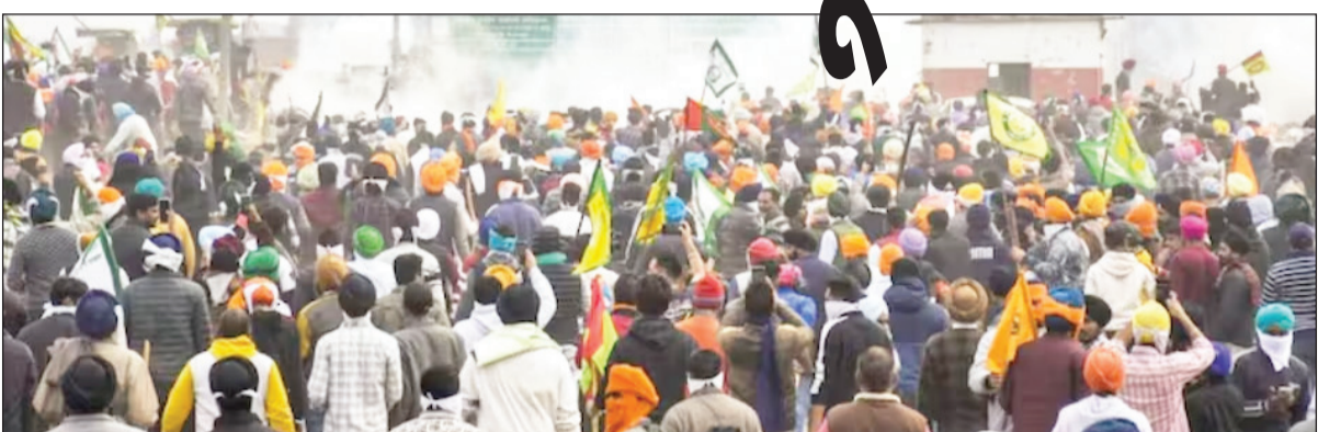
ખેડૂતોએ શરૂ કરેલા આંદોલનને પગલે દિલ્હી-નોઈડા બોર્ડર સીલ: આંદોલનકારી ખેડૂતોને રોકવા દિલ્હી પોલીસે જારી કરેલી એડવાઈઝરી

નવી દિલ્હી, તા.૦૨ સંયુક્ત કિસાન મોરચાના નેજા હેઠળ આજે હજારો ખેડૂતો દિલ્હી તરફ કૂચ કરશે. એક દિવસ પહેલાં ખેડૂતો અને વહીવટીતંત્ર વચ્ચે ઉચ્ચ સ્તરીય બેઠક યોજાઈ હતી. રવિવારે જ્યારે માંગણીઓ પર કોઈ સહમતિ ન બની ત્યારે તેમણે 'ચલો દિલ્હી'ના નારા લગાવ્યા હતા. ખેડૂતો હવે સંસદનો ઘેરાવ કરવા માંગે છે. આંદોલનકારી ખેડૂત સંગઠનો જમીન સંપાદનથી પ્રભાવિત ખેડૂતોને 10 ટકા વિકસિત પ્લોટ અને નવા જમીન સંપાદન કાયદાના લાભની માંગ કરી રહ્યા છે. હાલમાં ખેડૂતોની જાહેરાત બાદ નોંધણી અને દિલ્હી પોલીસ સતર્ક થઈ ગઈ છે અને બોર્ડર પર તકેદારી રાખવામાં આવી રહી છે. નોંધણી અને આવેલી તમામ બોર્ડર પર બેરિકેડિંગ કરવામાં આવ્યું છે. નોંધણી અને દિલ્હી પોલીસે સંકલન સ્થાપિત કર્યું છે. મેટ્રોનો ઉપયોગ કરવાની સલાહ આપવામાં આવી છે. ખેડૂતોનું કહેવું છે કે નવા જમીન સંપાદન કાયદા મુજબ 1 જાન્યુઆરી 2014 પછી સંપાદિત થયેલી જમીન માટે ચાર ગણું વળતર મળવું જોઈએ. ગૌતમ બુદ્ધ નગરમાં છેલ્લા 10 વર્ષથી સર્કલના દરમાં વધારો કરવામાં આવ્યો નથી. નવા જમીન સંપાદન કાયદાનો લાભ જિલ્લામાં લાગુ થવો જોઈએ. ખેડૂતો ઈચ્છે છે કે જમીન