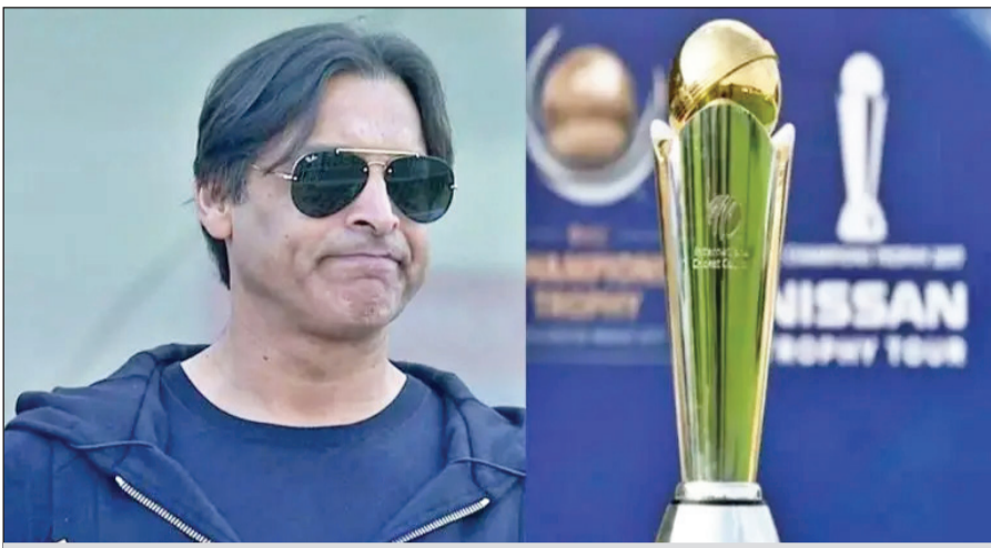
પાકિસ્તાનના પૂર્વ ઝડપી બોલર શોએબ અખ્તરે પોતાના નિવેદનમાં ભારત જાઓ અને ત્યાં તેમને મારી આવો... કહેતા વધુ વિવાદ વકર્યો

પાકિસ્તાનની ટીમના પૂર્વ ફાસ્ટ બોલર શોએબ અખ્તરે ચેમ્પિયન્સ ટ્રોફી 2025 ના વિવાદ વચ્ચે પોતાના નિવેદનથી હલચલ મચાવી દીધી છે. તેમનું કહેવું છે કે પાકિસ્તાનની ટીમે ભવિષ્યમાં ભારત જઈને આઈસીસી ઈવેન્ટ્સ રમવાની ના પાડવી જોઈએ, પરંતુ પાકિસ્તાનની ટીમને એવી રીતે તૈયાર કરવી જોઈએ કે તે ભારતને તેની જ ધરતી પર હરાવીને પરત કરે.