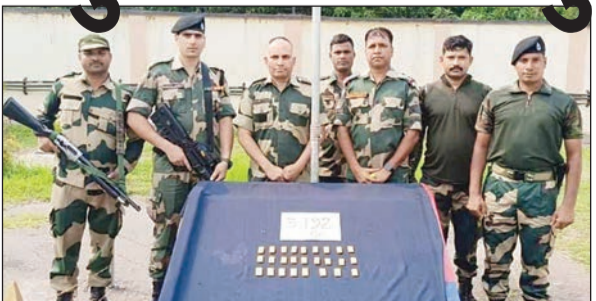
અધિકારીઓએ એમ પણ જણાવ્યું છે કે બીએસએફ દ્વારા આ વર્ષે દરમિયાન ડ્રગ દાણચોરીની કોલામમાં 51 ભારતીય અને 10 બાંગ્લાદેશી દાણચોરીની પણ ધરપકડ થઈ ચુકી છે. આ વર્ષે જાન્યુઆરીથી નવેમ્બર અંત સુધીમાં

ભારત-બાંગ્લાદેશ સીમા પર દાણચોરીમાં સતત થતો વધારો કોલકત્તા, તા.૦૨ દક્ષિણ બંગાળ સરહદે તેનાત બીએસએફની પાંખે વર્ષ 2024માં નવેમ્બર મહિનાના અંત સુધીમાં 86 ભારતીય અને 32 બાંગ્લાદેશી દાણચોરીની અટકાયત કરીને રૂપિયા 120 કરોડના મુલ્યનો સોનાચાંદીનો જથ્થો જપ્ત કર્યો હતો. અધિકારીઓએ રવિવારે આ જાણકારી આપી હતી. અધિકારીઓએ એમ પણ જણાવ્યું છે કે બીએસએફ દ્વારા આ વર્ષે દરમિયાન ડ્રગ દાણચોરીની કોલામમાં 51 ભારતીય અને 10 બાંગ્લાદેશી દાણચોરીની પણ ધરપકડ થઈ ચુકી છે. આ વર્ષે જાન્યુઆરીથી નવેમ્બર અંત સુધીમાં બીએસએફ દક્ષિણ બંગાળની સરહદેથી 170.48 કીલો સોનુ અને 159 કીલો ચાંદી જપ્ત કરી હતી. તેની કિંમત અનુક્રમે રૂપિયા 118.63 કરોડ અને 1.15 કરોડ થવા જાય છે. આ સમય ગાળા અનુસંધાન પાના ૭ પર